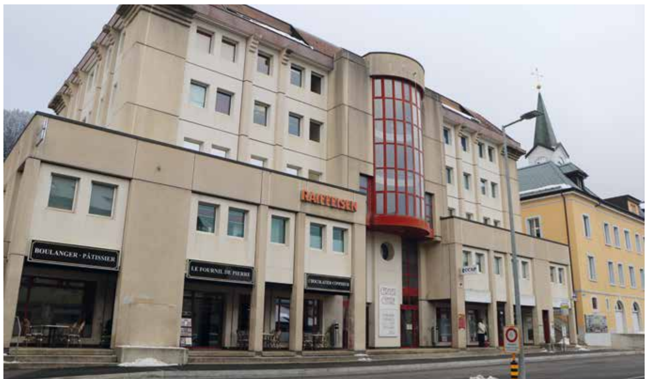
L'intérieur du bâtiment rue de l'Epervier 4 sera complètement réaménagé pour accueillir l'administration communale. (Photo pif).

Un important quartier de logements adaptés aux personnes âgées devrait bientôt voir le jour aux Geneveys-sur-Coffrane: couplé au vieillissement de la population, le fait de disposer d'une structure médicale complète à proximité prend d'autant plus tout son sens. /pif