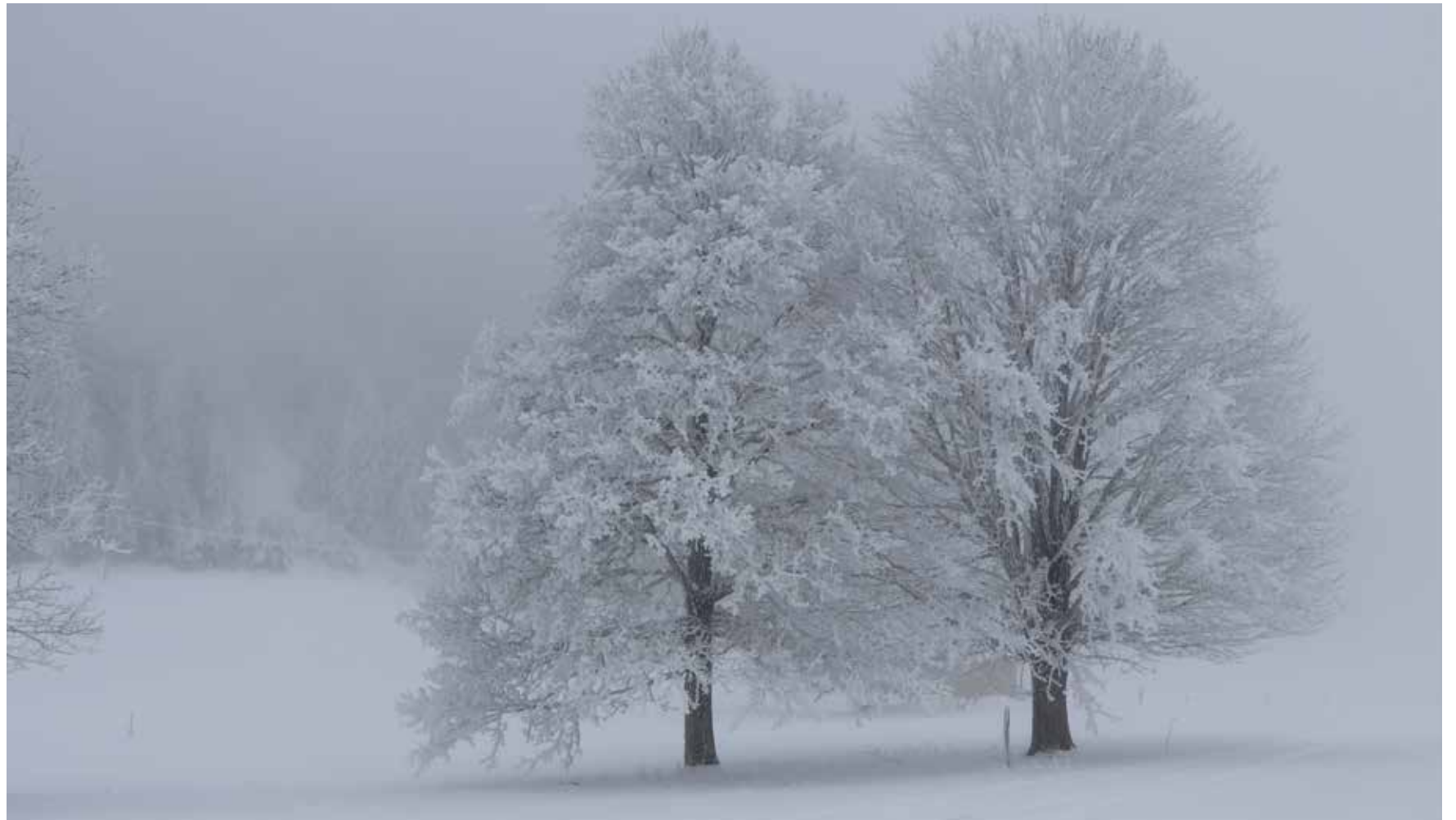
Brouillard, bise et froid: après un redoux inhabituel, l'hiver a bel et bien débarqué. Mais la couche de neige est restée mince sur les hauteurs en janvier. Toutes les remontées mécaniques des stations du Val-de-Ruz ont fonctionné au moins partiellement.