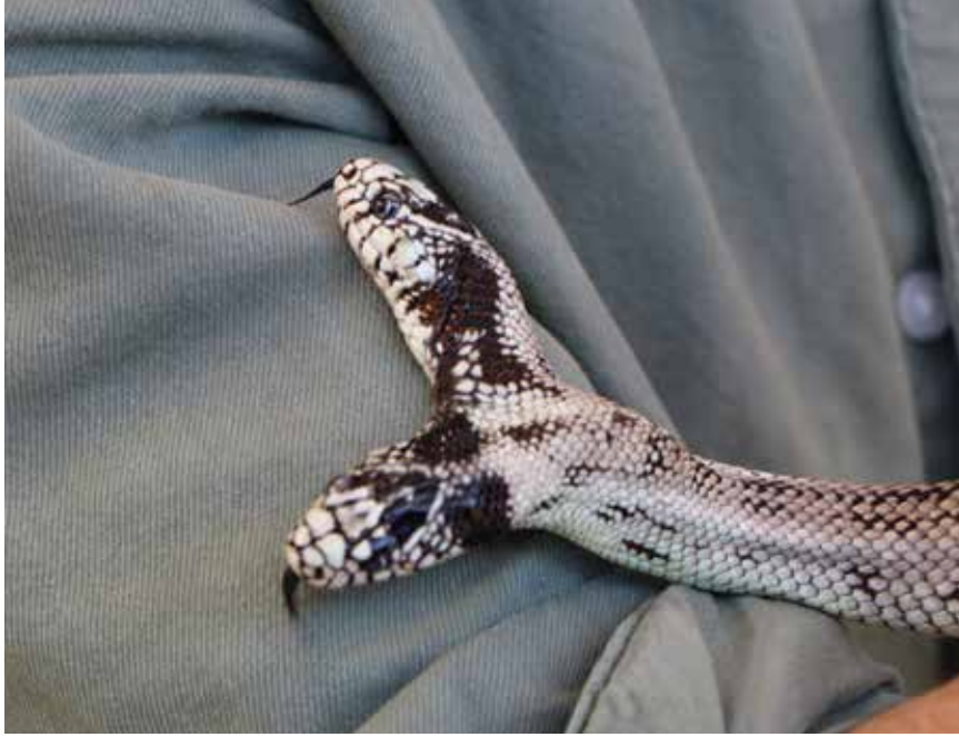
La mascotte de l'Expo: Tom et Jerry, le fameux serpent à deux têtes. (Photo pif).

Après les dinosaures l'été dernier, place aux animaux vivants: «Reptiles Expo» se tient jusqu'au 5 mars au Mycorama de Cernier. Des bêtes repoussantes pour certains, mais qui peuvent aussi fasciner, les petits comme les grands. Une exposition qui est aussi l'histoire de passionnés.