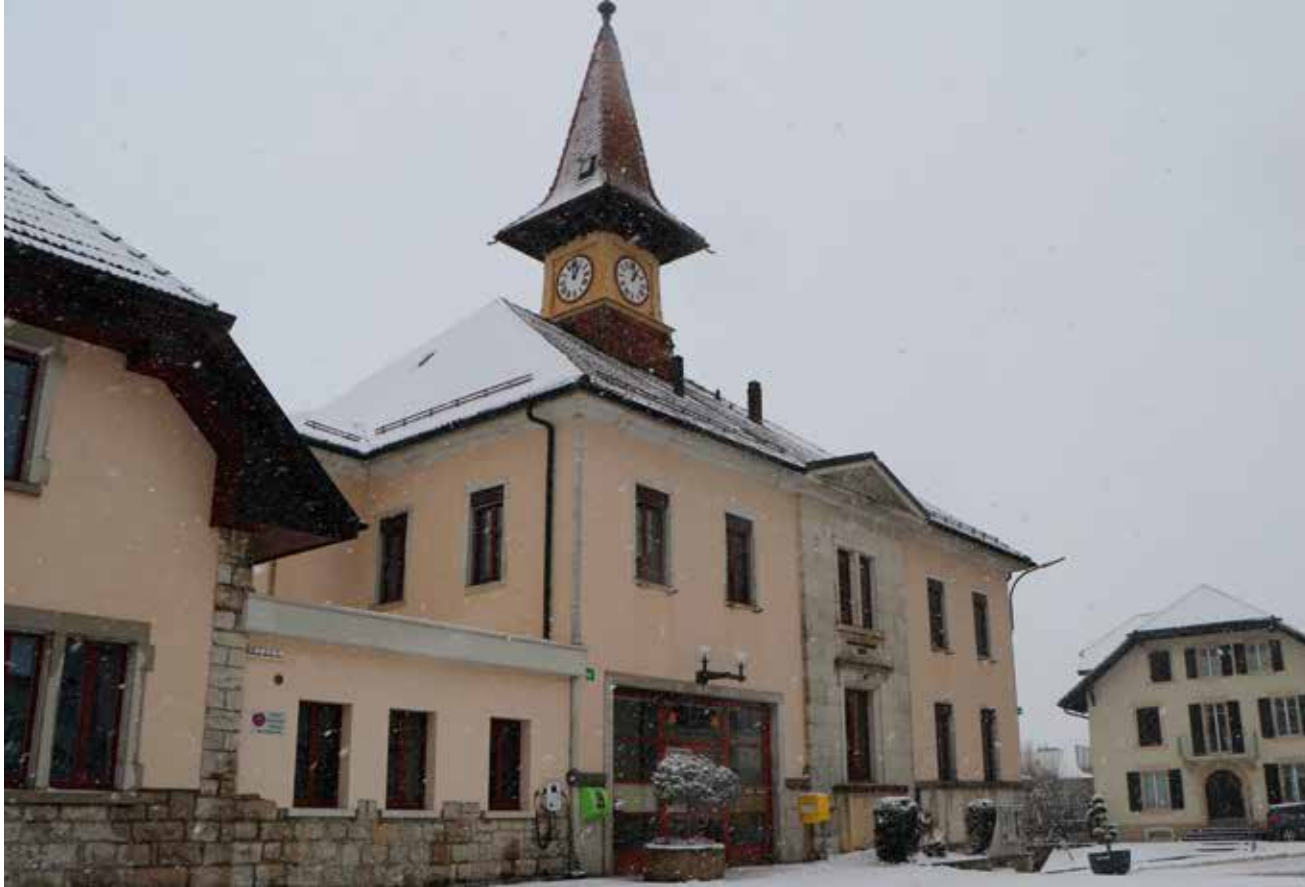
Le bâtiment communal des Geneveys-sur-Coffrane deviendra bientôt un centre de santé.

Le déménagement est en cours: dès la fin du mois, l'ensemble de l'administration communale de Val-de-Ruz sera centralisée à Cernier. Elle était jusqu'ici répartie sur deux sites. Les collaborateurs des services de l'urbanisme, de la sécurité et des travaux publics quittent définitivement les Geneveys-sur-Coffrane. Le bâtiment communal qu'ils occupaient ne sera pas vide longtemps. Il restera au service de la population, puisqu'il fera l'objet d'une transformation en centre médical de jour d'une part et de l'autre en centre de soins alternatifs et de bien-être.