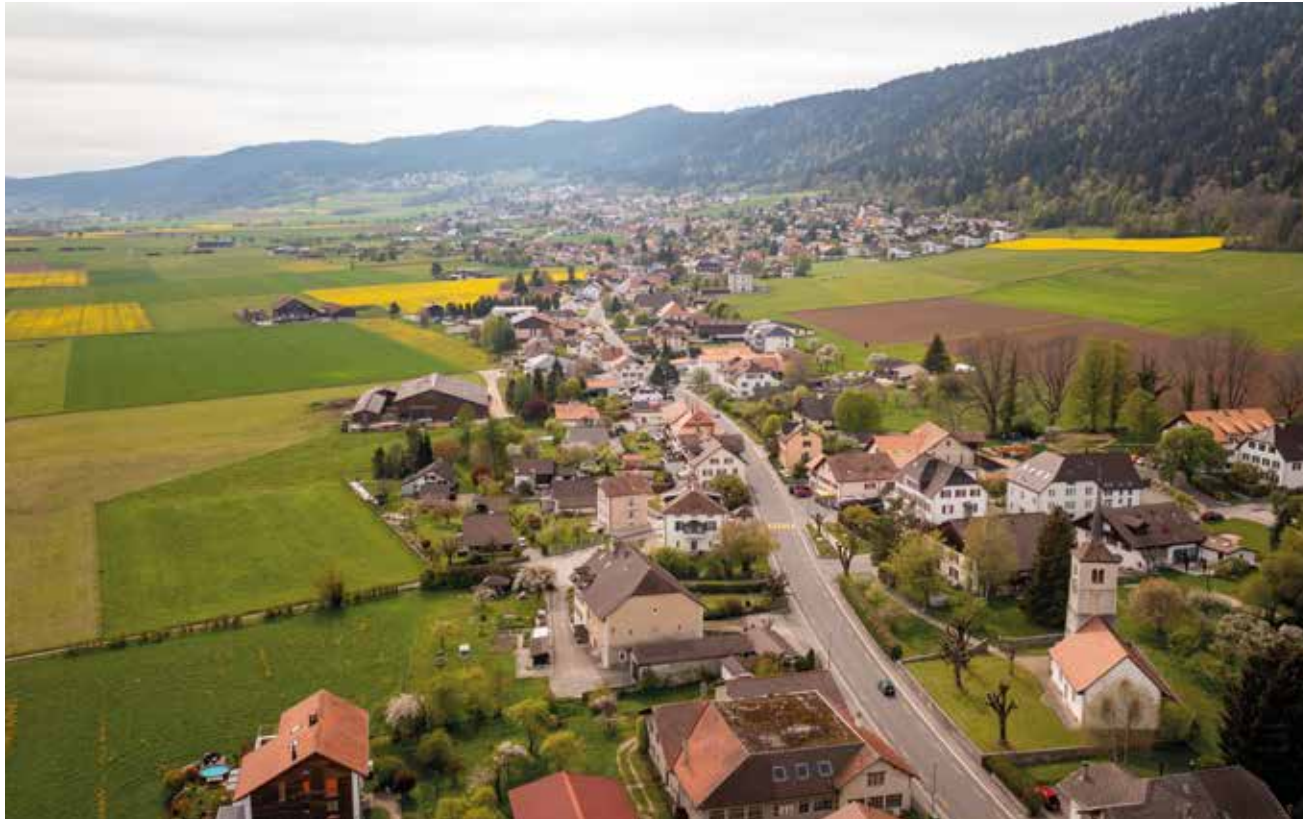
Chézard-Saint-Martin fera sa fête en juin. (Photo Quentin Juvet).

«Il était une fois Chézard-Saint-Martin»: 13 ans après la dernière fête villageoise, celle-ci sera de retour en juin prochain. Durant un long week-end, animations, stands, concerts, spectacles, rallye, bar et disco devraient rassembler petits et grands.